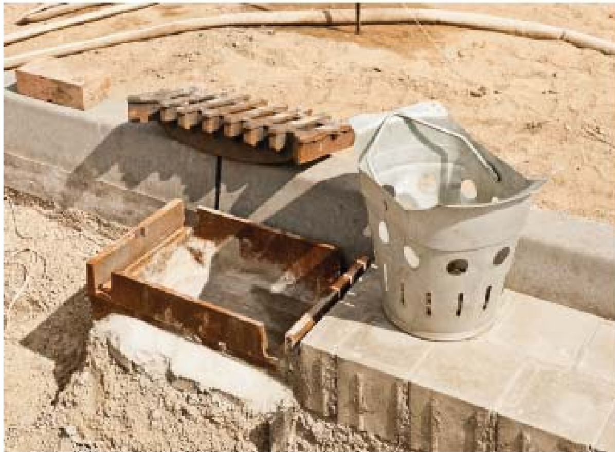
Figura 4.10. Detalle de cesto para imbornal en vía pública.