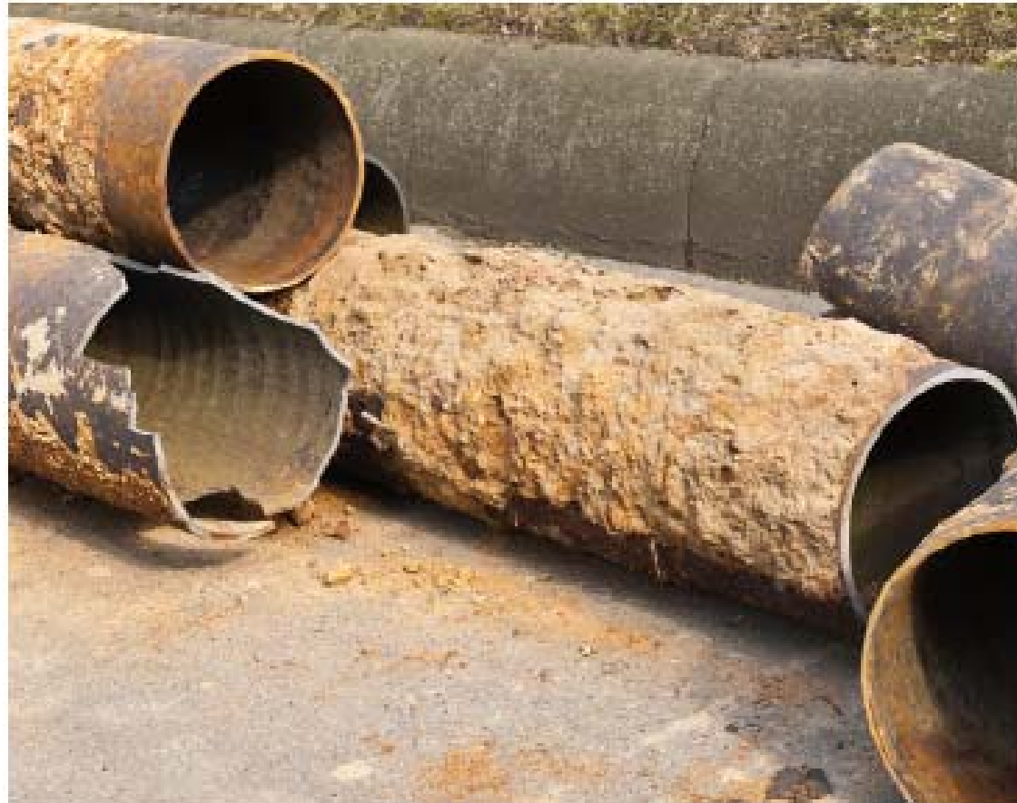
Figura 4.5. Tuberías de fundición.