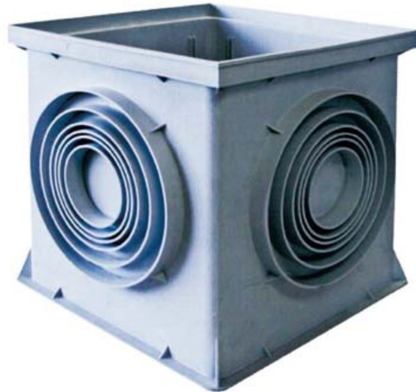
Figura 4.8. Arqueta prefabricada en PVC.