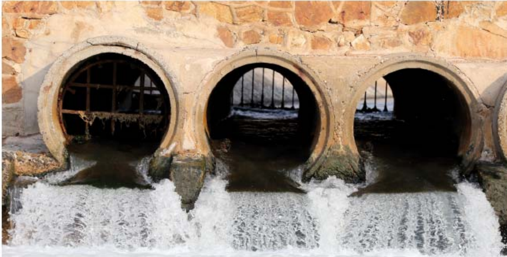
Figura 4.13. Vertido de aguas tratadas.