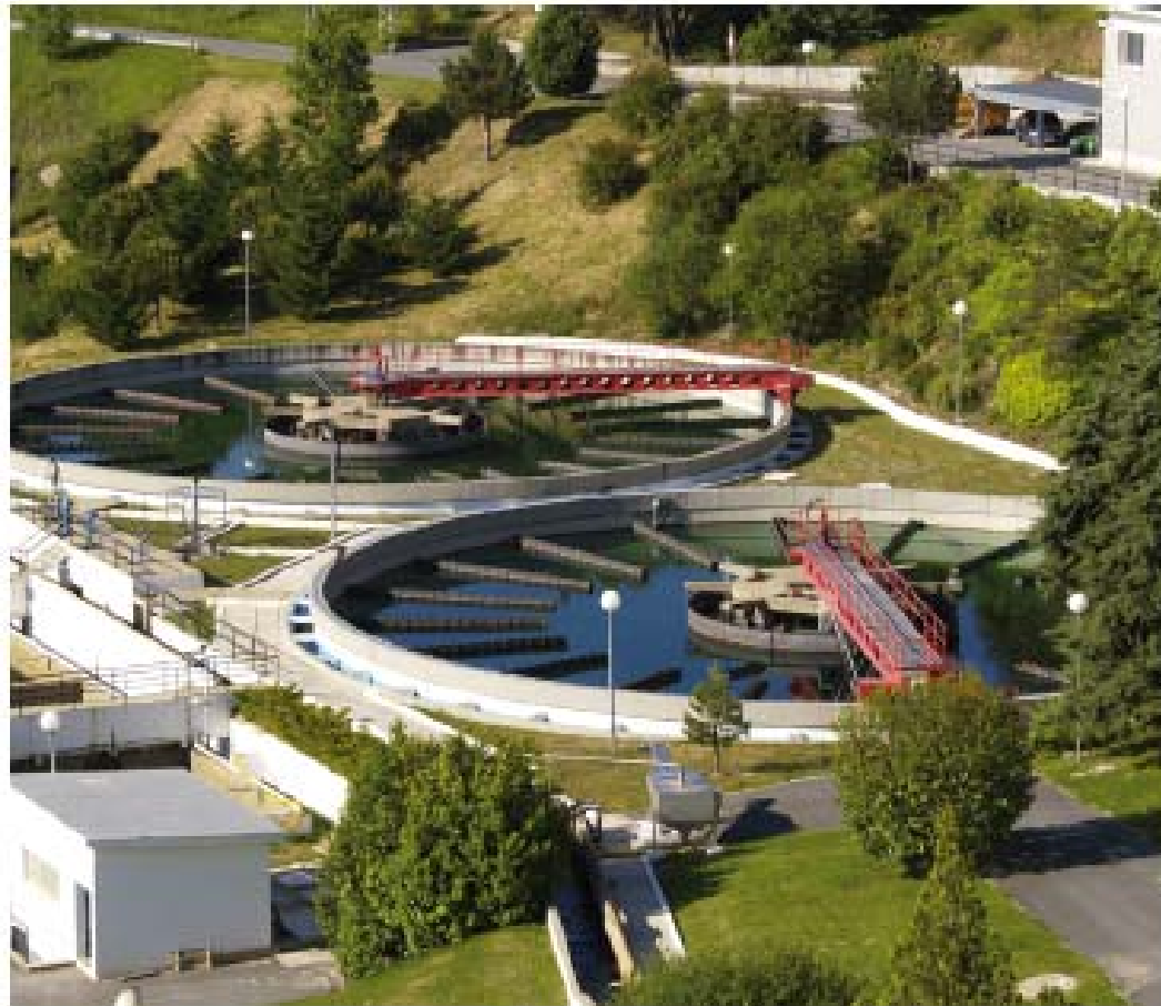
Figura 4.11. Estación depuradora de aguas residuales.