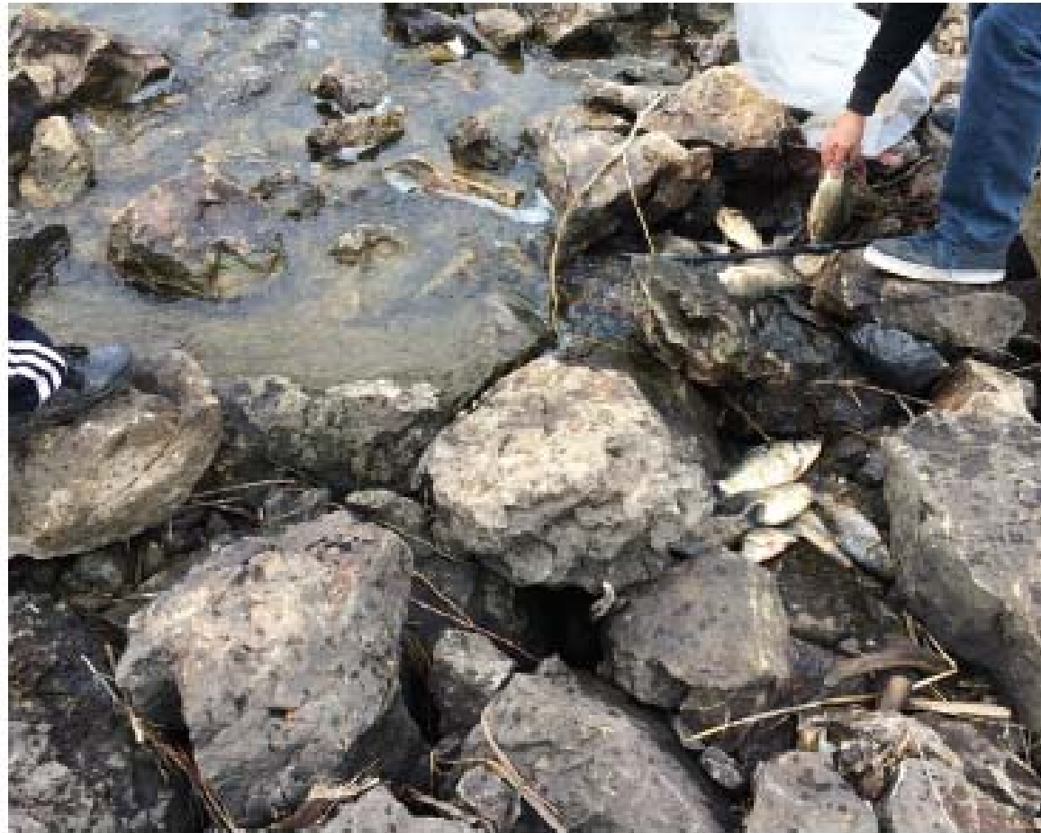
Figura 4.12. Contaminación de las aguas de un río por vertido.