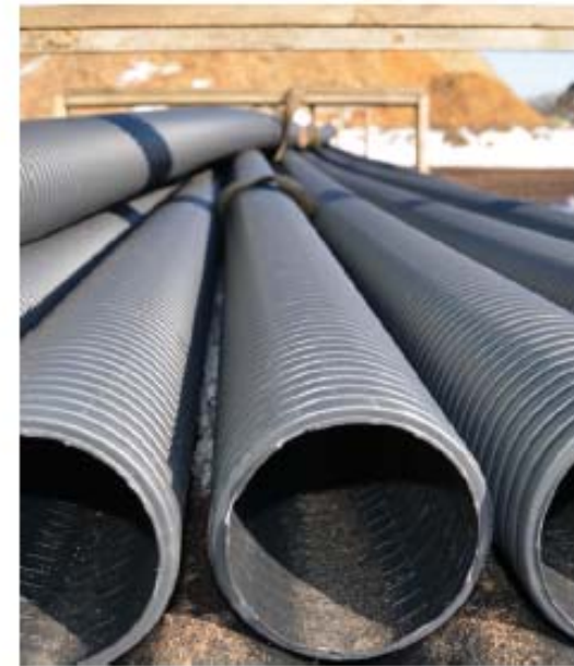
Figura 4.4. Tuberías de PVC de pared corrugada.