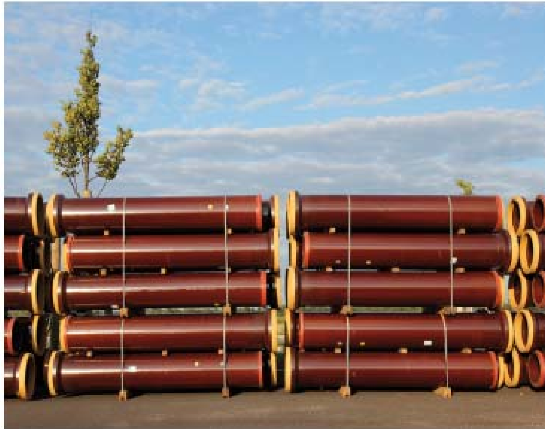
Figura 4.6. Tuberías de gres.