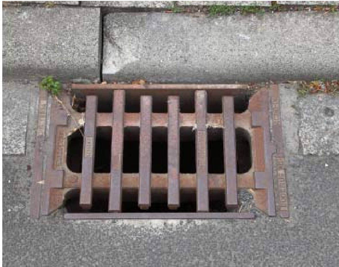
Figura 4.9. Sumidero en la vía pública.