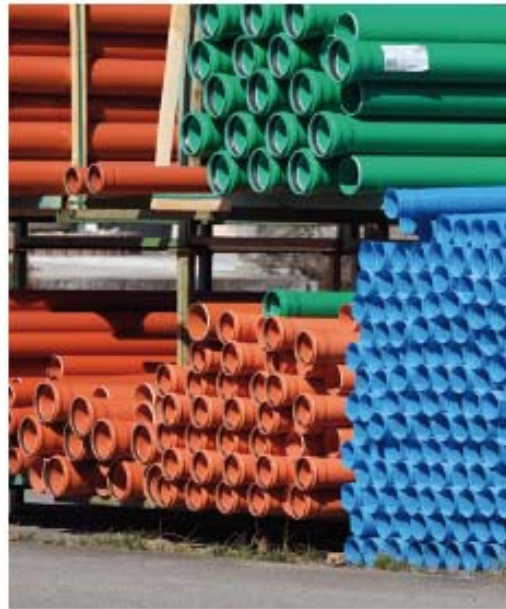
Figura 4.3. Tuberías de PVC de pared lisa.