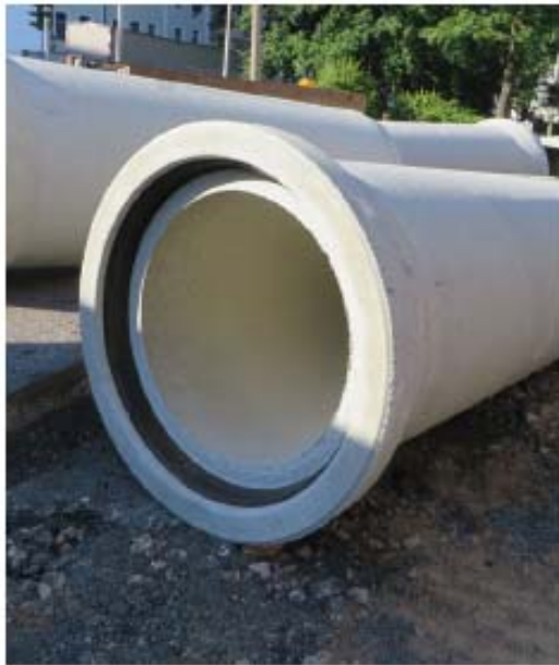
Figura 4.2. Tuberías de hormigón.