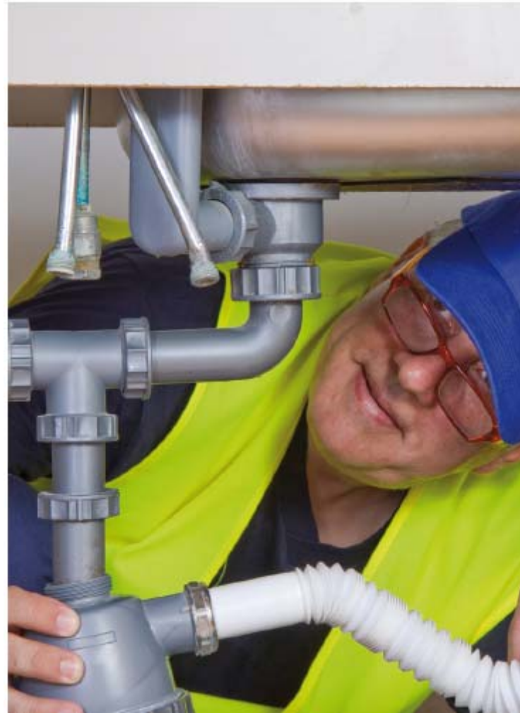
Figura 8.4. Desmontaje del sifón.