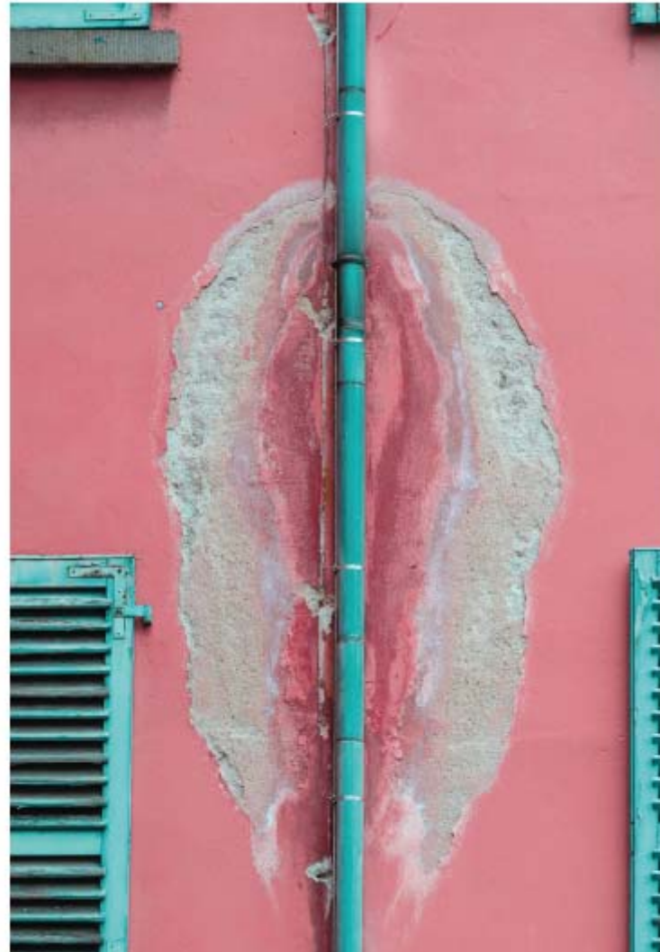
Figura 8.9. Detalle de una fuga de una bajante de pluviales en una fachada.