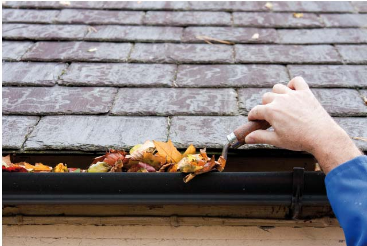
Figura 8.2. Limpieza de canalones.