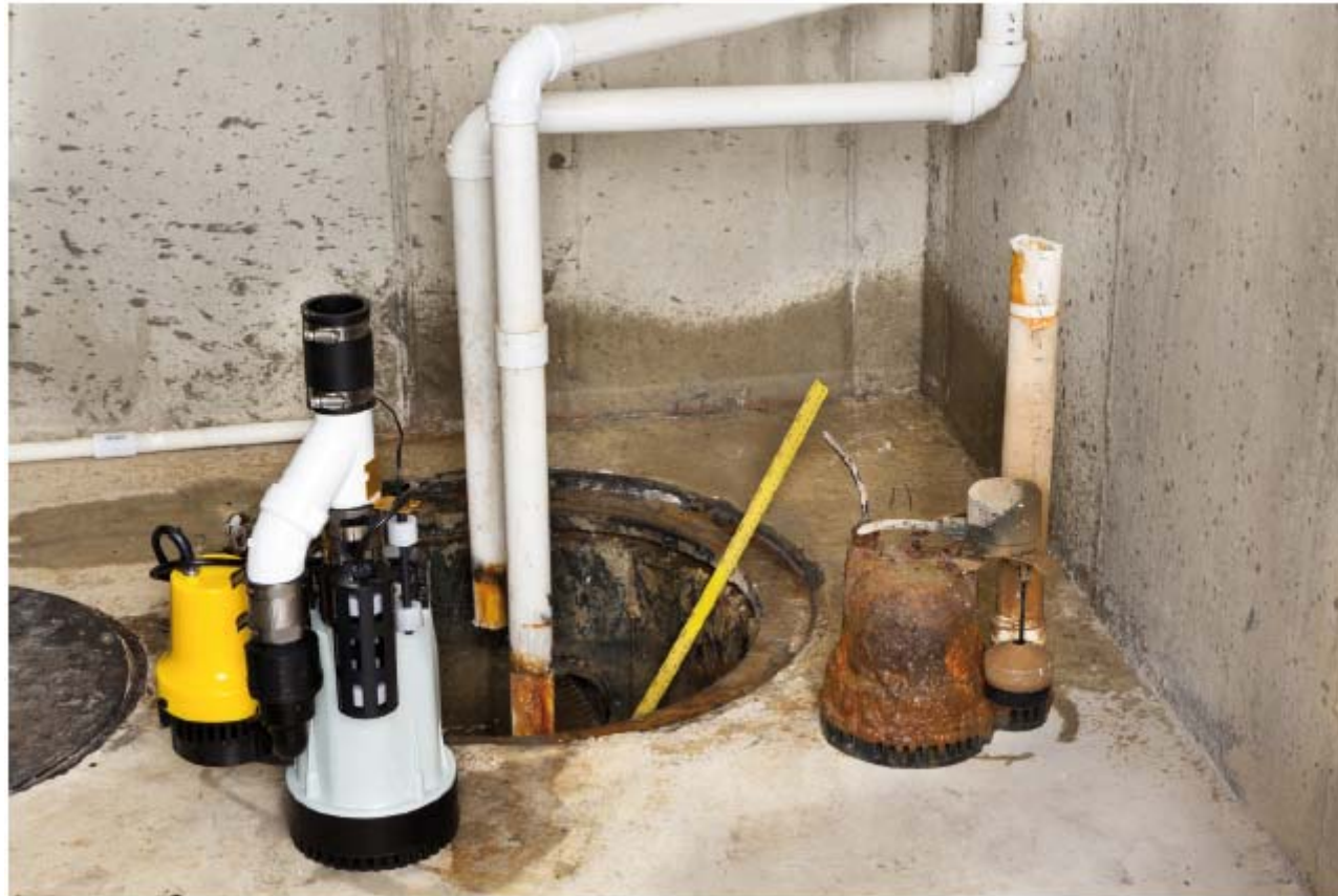
Figura 8.3. Sustitución de un equipo de bombeo.