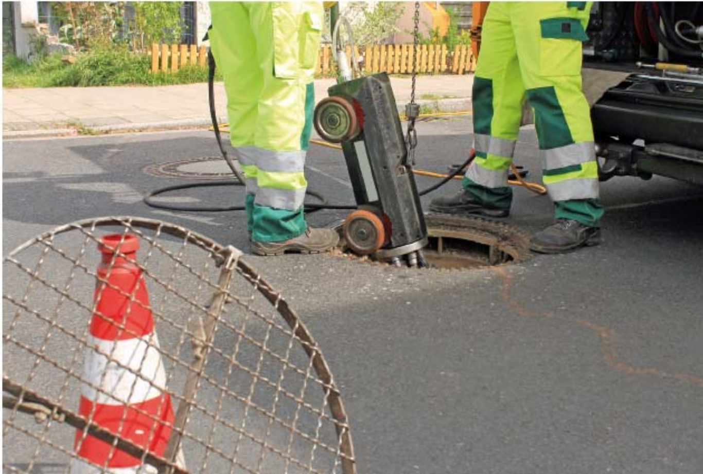
Figura 8.6. Equipo móvil para desatasco de la red saneamiento.