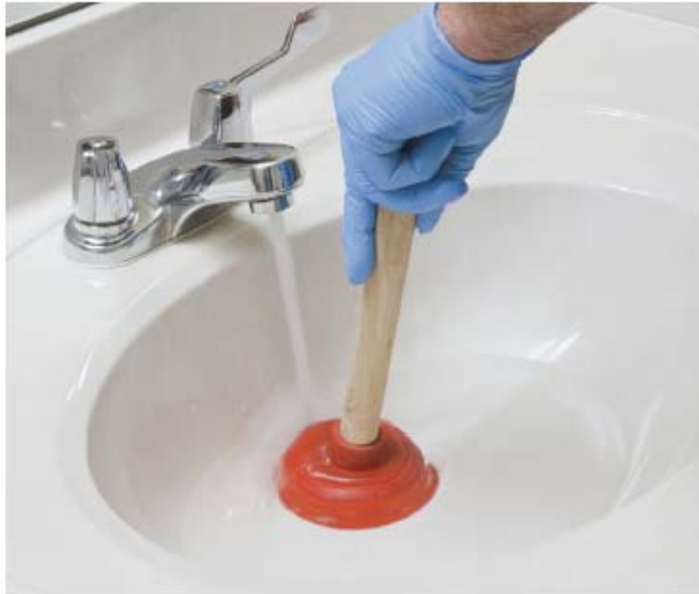
Figura 8.7. Eliminación de atasco en el lavabo con un desatascador de ventosa.