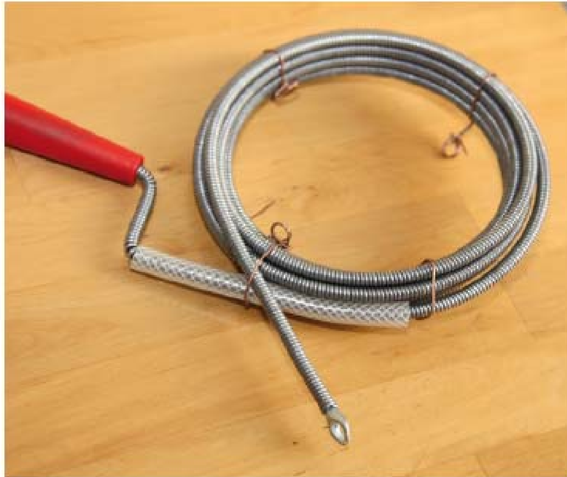
Figura 8.8. Muelle desatascador.