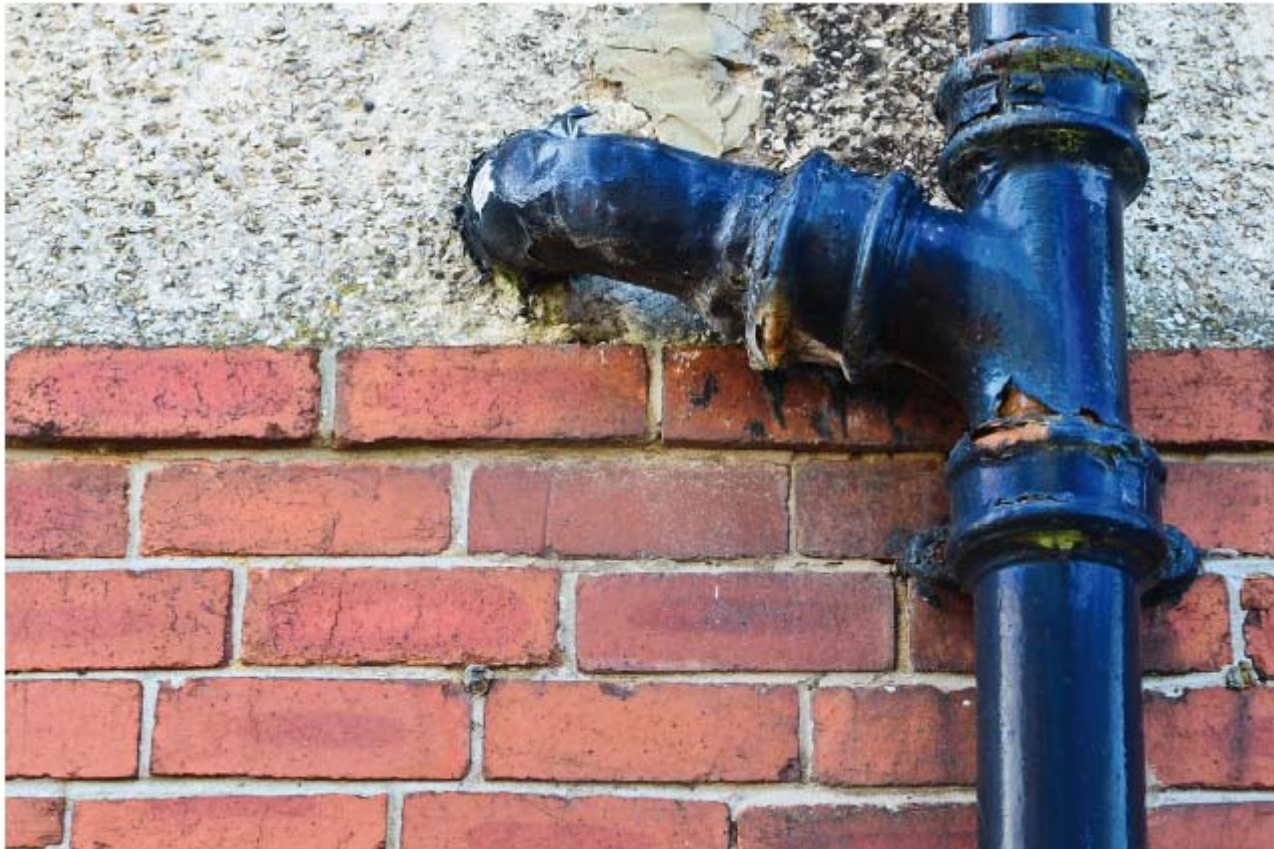
Figura 8.1. Deterioro en una bajante exterior.